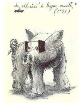
croquis Alain Leonesi

Raymond Cousse se suicide le 22 Décembre 1991.